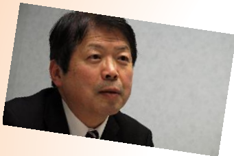
平岡 秀夫 弁護士 (元法務大臣)